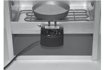
Elektroheizung mit Räuchermehlschale